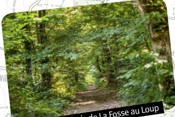
© Le bois de La Fosse au Loup