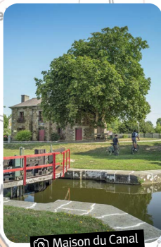
Canal d'Ille-et-Rance et site des 11 écluses